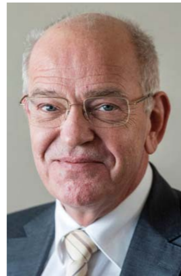
Gerrit Zalm: vertrekt in de loop van 2017