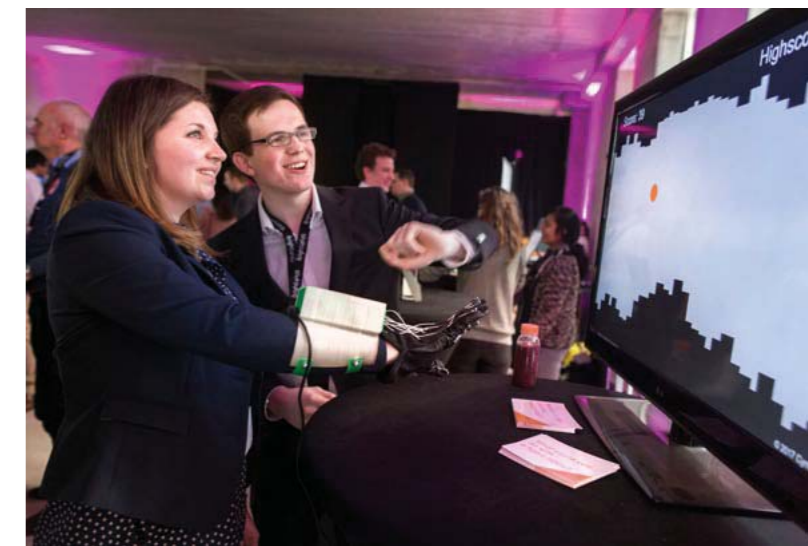
Er waren ook diverse demonstraties van start-ups.

Het kantelpunt in haar leven. Ze ging nog eens diep het medische circuit in om de oorzaak van alle ellende te achterhalen. Dat bleek de ziekte van Hashimoto te zijn, een auto-immuunziekte die tot een chronische ontsteking van de schildklier leidt. Een aandoening